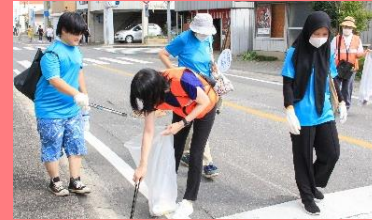
あいホーム石岡の利用者様が クリーンアップ作戦に 参加しました！